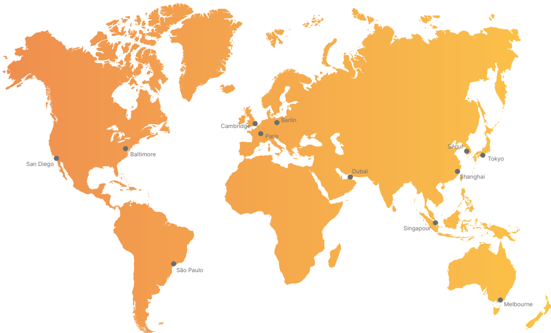
Figure 1 : Le réseau grandissant de centres de solutions d'Illumina à l'échelle mondiale.

Les chercheurs peuvent également bénéficier de consultations postservice pour examiner l'ensemble du flux de travail de transformation d'échantillons en réponses et discuter des étapes à suivre pour mettre en œuvre avec succès ces flux de travail au sein de leurs laboratoires. Tous les produits livrables, notamment les données et les rapports d'analyse générés, sont fournis par l'intermédiaire de BaseSpace Sequence Hub ou sur un disque dur externe.