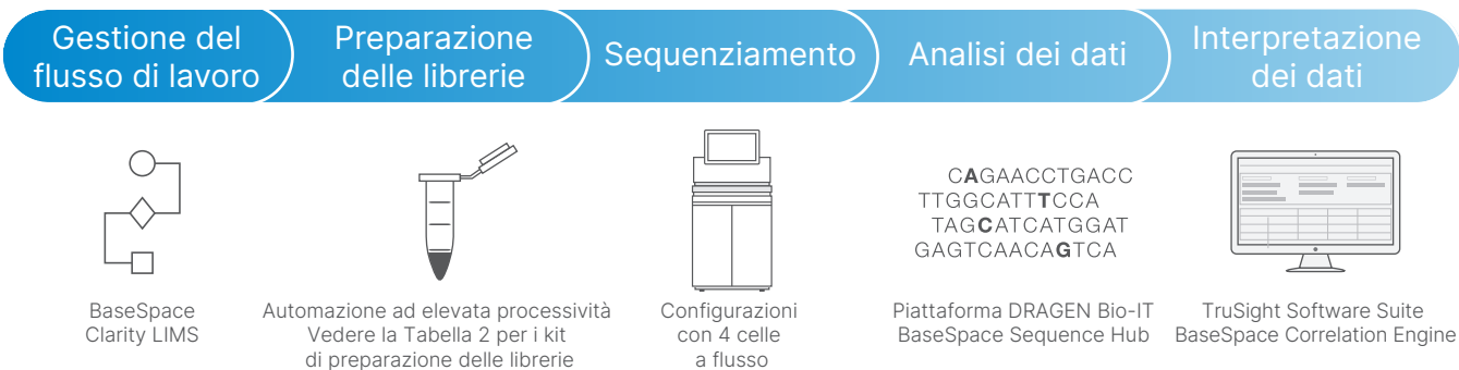
Figura 4: Flusso di lavoro NGS NovaSeq 6000 System: il NovaSeq 6000 System è compatibile con BaseSpace Clarity LIMS, con la gamma di kit di preparazione delle librerie Illumina, con il supporto per i "metodi qualificati" Illumina, con le soluzioni di analisi dei dati come la piattaforma DRAGEN Bio-IT e BaseSpace Sequence Hub e con gli strumenti di interpretazione dei dati a valle come TruSight Software Suite e BaseSpace Correlation Engine.

Bio-IT per l'analisi secondaria ultra rapida e accurata dei dati NGS oppure accedere alle applicazioni BaseSpace per l'allineamento e il rilevamento delle varianti, l'annotazione, la visualizzazione e altro. Per altre opzioni di analisi, incluse le pipeline presenti in laboratorio, NovaSeq System Software genera identificazioni delle basi e punteggi qualitativi convertiti in file FASTQ per l'analisi a valle.