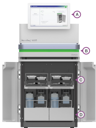
Figura 3: Funzionamento ottimizzato: molte caratteristiche del NovaSeq 6000 System sono progettate per semplificare gli studi di genomica, inclusi (A) l'interfaccia intuitiva su touch screen, (B) il display LED dotato di spie luminose che indica lo stato della cella a flusso, (C) le cartucce sagomate contenenti i reagenti pronti all'uso e (D) i contenitori per gli scarti facili da rimuovere e smaltire.