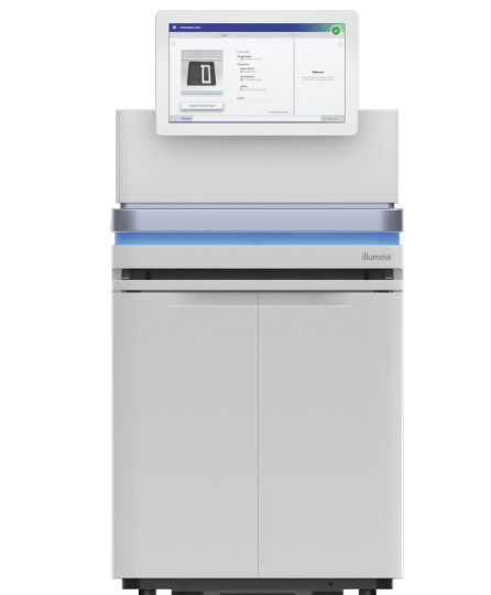
Figure 1 : Système NovaSeq 6000 : il transforme le séquençage en alliant débit, souplesse et simplicité d'utilisation pour pratiquement tout génome, toute méthode et toute échelle.

Le système NovaSeq 6000 permet un rendement pouvant atteindre 6 Tb et 20 milliards de lectures par analyse d'une double S4 en moins de deux jours. De multiples combinaisons de types de Flow Cell et de longueurs de lecture offrent des configurations de rendement et de durée d'analyse flexibles en fonction des besoins des projets (tableau 1).