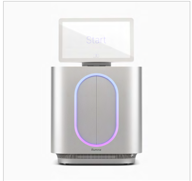
그림 1: MiSeq i100 및 MiSeq i100 Plus 시퀀싱 시스템 Illumina의 기술 혁신은 계속해서 간편성에 중점을 둔 벤치탑 시스템으로 NGS의 접근성을 높이고 있음

바로 사용할 준비가 되어 있는 시약 카트리지와 소모품은 실온 배송 및 보관되므로 시퀀싱 단계 전 시약이 해동되기를 기다릴 필요가 없습니다. 직관적인 인포매틱스(informatics, 정보학)로 터치포인트를 간소화하고 바이오인포매틱스(bioinformatics, 생명정보학) 전문가의 필요성을 최소화해 간편한 분석을 지원하는 초보자와 전문가 모두에게 유용한 시스템입니다.