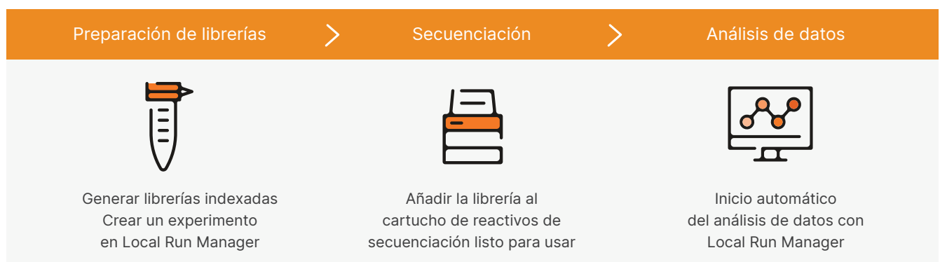
Figura 2: iSeq 100 System forma parte de un flujo de trabajo optimizado de ADN a datos.

iSeq 100 System forma parte de un flujo de trabajo optimizado en tres pasos que incluye la preparación de librerías, la secuenciación y el análisis de los datos (figura 2).