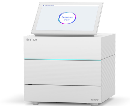
Figura 1: iSeq 100 System. Aproveche la potencia de la secuenciación de nueva generación (NGS, next-generation sequencing) en el sistema de secuenciación de sobremesa más compacto y asequible de la gama de soluciones de Illumina.