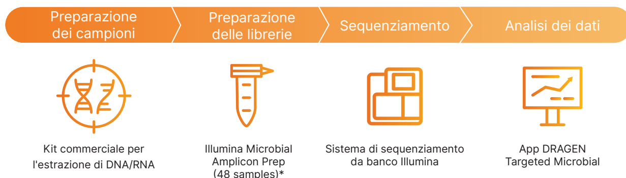
Figura 2. Flusso di lavoro Illumina Microbial Amplicon Prep. In un flusso di lavoro semplificato, le librerie microbiche vengono preparate utilizzando il kit Illumina Microbial Amplicon Prep, sequenziate su qualsiasi sistema di sequenziamento da banco Illumina e analizzate nell'app DRAGEN Targeted Microbial per il rilevamento, l'identificazione di varianti e la tipizzazione dei ceppi. *Il kit include gli indici per la preparazione delle librerie. Gli oligonucleotidi del primer devono essere acquistati separatamente.