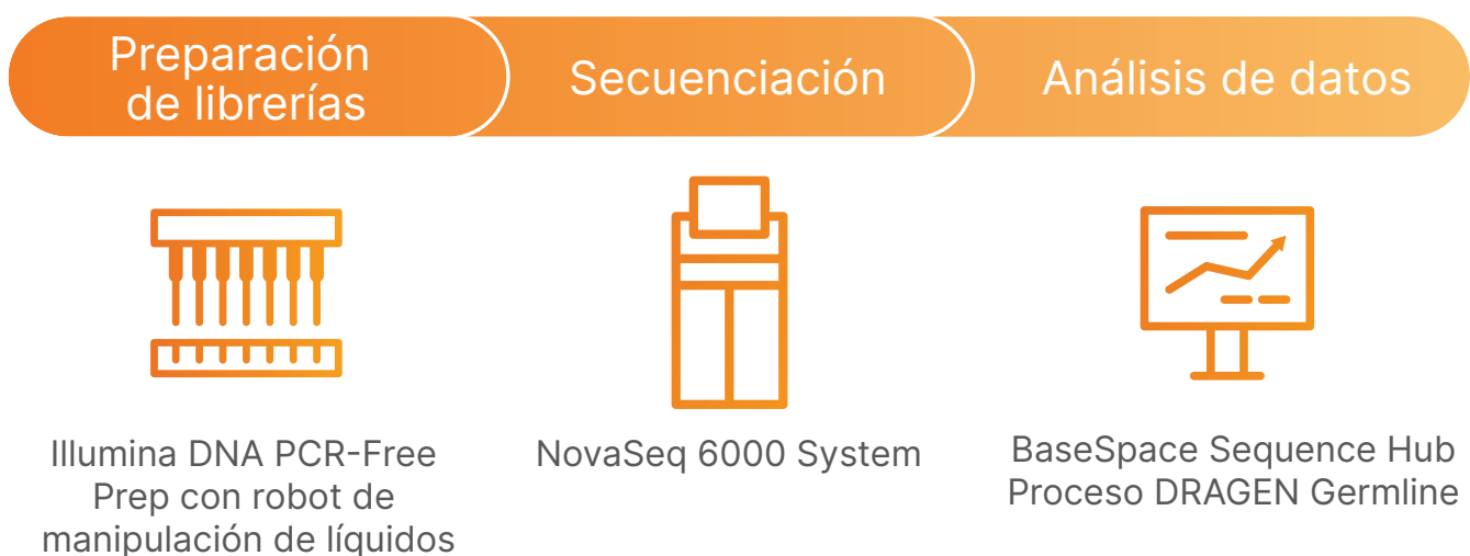
Figura 1: Flujo de trabajo de WGS de Illumina Genomics Architecture. IGA admite un flujo de trabajo de ADN a datos para WGS que integra la preparación automatizada de librerías con Illumina DNA PCR-Free Prep, la secuenciación en NovaSeq 6000 System y el análisis con el proceso DRAGEN Germline.

Las librerías de secuenciación se prepararon con Illumina DNA PCR-Free Prep (Illumina, n.º de catálogo 20041794) a partir de 400 ng de ADN genómico (ADNg) de alta calidad extraído de muestras de sangre recogidas de personas sanas registradas como parte del proyecto SG100K. La preparación de librerías se automatizó con la plataforma de manipulación de líquidos Hamilton STAR.