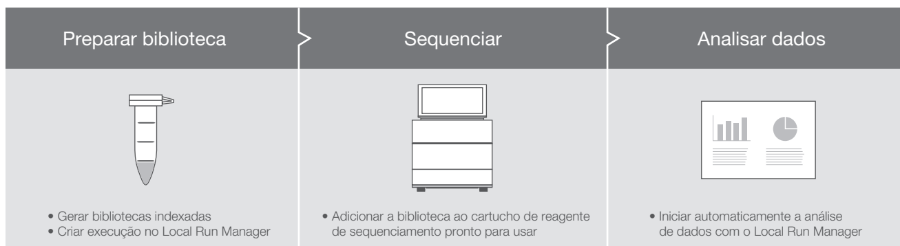
Figura 2: Fluxo de trabalho do sistema iSeq 100 — O sistema iSeq 100 faz parte de um fluxo de trabalho simplificado de DNA para dados.

O sistema iSeq 100 faz parte de um fluxo de trabalho simplificado de três etapas que inclui preparação de bibliotecas, sequenciamento e análise de dados (Figura 2).