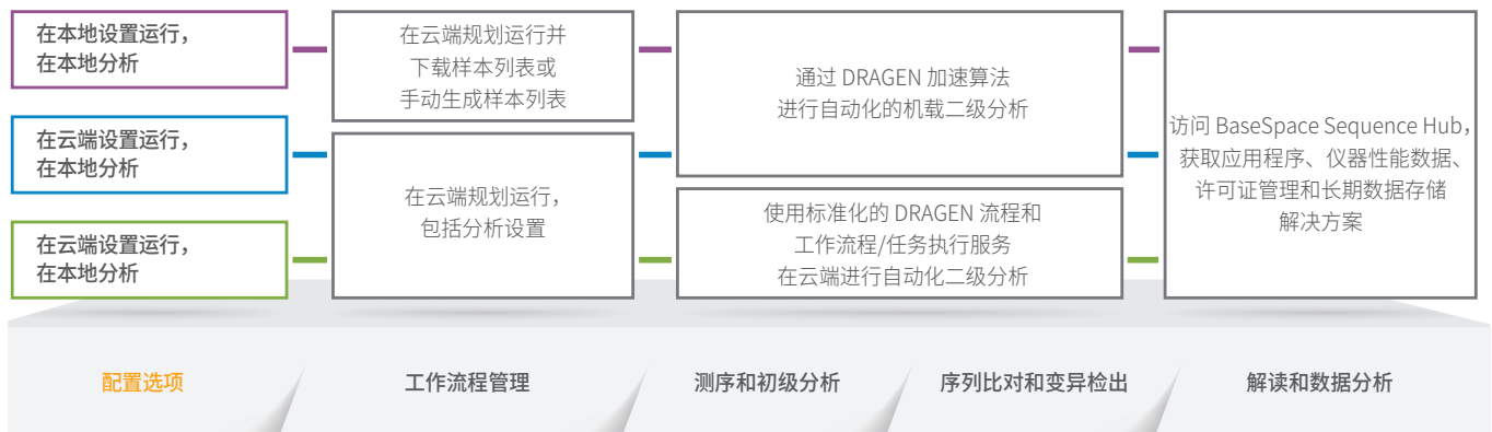
图 3 :灵活的生信分析套件 — NextSeq 1000 和 NextSeq 2000 系统在运行设置、运行管理和数据分析方面, 有本地和云端两个选项, 能让用户以自己的方式运行测序。