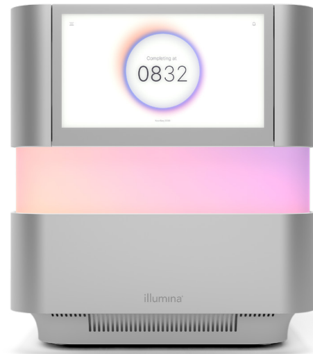
图 1 :NextSeq 2000 测序系统 — NextSeq 2000 系统, 具有创新的设计、先进的测序化学体系、机载生物信息工具以及简便的工作流程, 可在台式测序仪上实现广泛且灵活的应用。

现在, 我们有了可扩展的 Illumina NextSeq 1000 和 NextSeq 2000 测序系统平台, 为今后的研究提供保障。